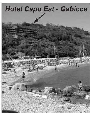
Hotel Capo Est - Gabicce

Comprensivo di viaggio in bus, accompagnatore, visite al Castello di Gradara, Pesaro o Riccione. Prenotazione senza alcun anticipo, saldo 15 giorni prima di partire, penale € 60 per chi rinuncia al viaggio a meno di 8 giorni dalla partenza.