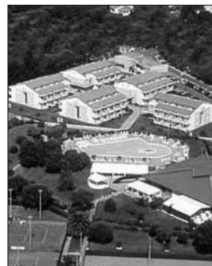
"La buca del gatto" Cecina

Bambini fino a tre anni in camera con due adulti pagano solo € 80, dai tre ai dodici anni sconto 40%; terzo letto adulti in camera sconto 5%. In caso di rinuncia al viaggio a meno di 15 giorni dalla partenza la penale è di € 150 a persona.