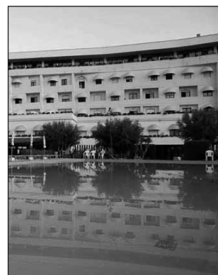
Hotel del Levante Torre Canne