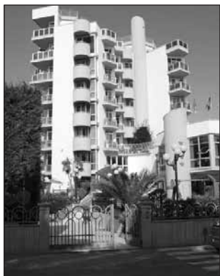
Hotel Meripol Alba Adriatica

Nei prezzi dei soggiorni non è compresa l'eventuale tassa di soggiorno. Se richiesta dovranno pagarla i partecipanti in hotel