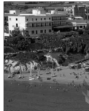
Hotel Helios - Noto

Caparra € 100 a persona, saldo almeno 15 giorni prima di partire: fino a tale data non un euro di penale per chi dovesse essere costretto a rinunciare alla vacanza; nel programma di ogni località sono poi indicate le penali per chi dovesse ritirarsi a meno di 15 giorni dalla partenza. In nessun soggiorno estivo è compresa l'assicurazione annullamento e non conviene sinceramente attivarla..