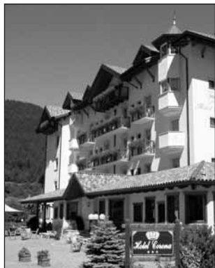
Hotel Corona - Andalo

Il prezzo è comprensivo di pensione completa con acqua e vino ai pasti; accompagnatore; viaggio di A/R in autobus, assicurazione sanitaria. Bambini ( in camera con due adulti) fino a 2 anni gratis; dai 3 ai dodici anni sconto 40%. Terzo letto in camera adulti, sconto del 10%. In caso di rinuncia al viaggio a meno di 15 giorni dalla partenza la penale è di € 70 a persona.