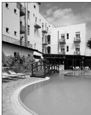
Hotel Angelini - Bellaria

Le camere sono tutte con balcone, aria condizionata e televisore, la spiaggia è la solita di sabbia, ampia e ben curata. La Romagna, si sa, riesce a fronteggiare anche gli eventi ambientali negativi che a volte si presentano nel mare con un impegno, una passione e una dedizione che affascinano e rendono indimenticabili la vacanza.