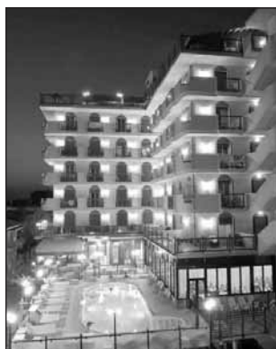
Hotel Brioni - Iesolo

Comodissimo alla spiaggia, con un arenile vastissimo e molto accogliente, l'hotel ha una bella piscina e sale interne che permettono di soggiornare beatamente anche in caso di pioggia, camere dotate di tutti i confort, offre un curatissimo trattamento a tavola con la scelta ogni giorno tra tre portate di primi e di secondi con un ricco e stupendo buffet di verdure. Dall'hotel, volendo, si possono poi fare escursioni bellissime: a poca distanza ci sono infatti Venezia, Treviso, Grado, Aquileia, una infinità di opportunità anche per chi ama scoprire e visitare luoghi tra i più affascinanti del nostro Paese.